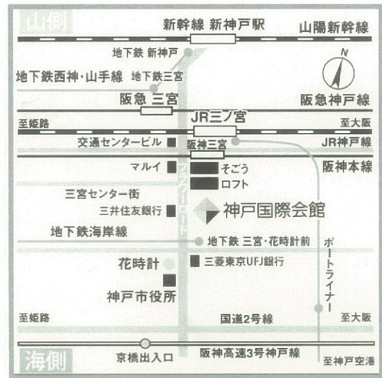
神戸国際会館アクセス