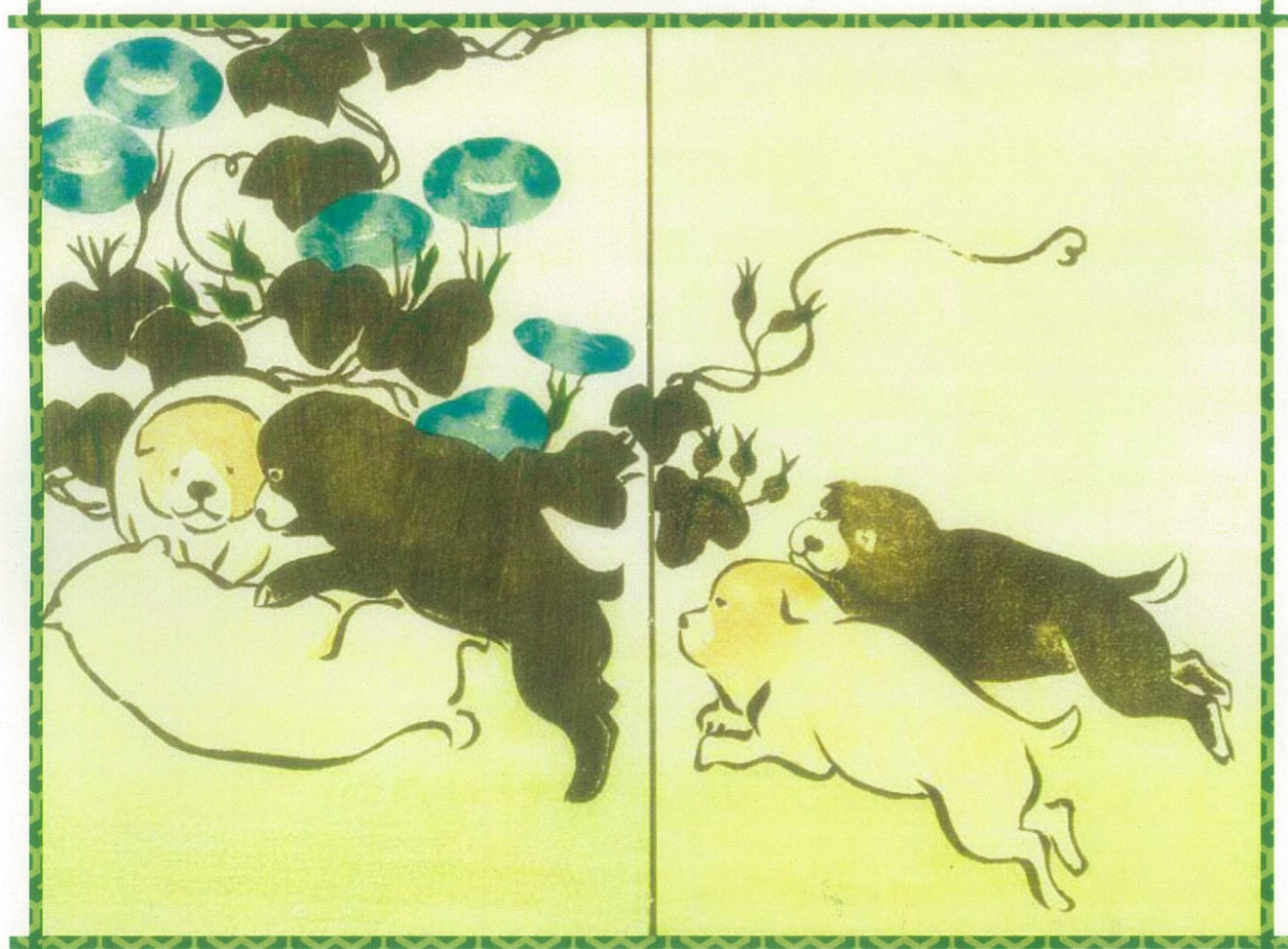
「光琳画式」尾形光琳 筆 芸艸堂刊