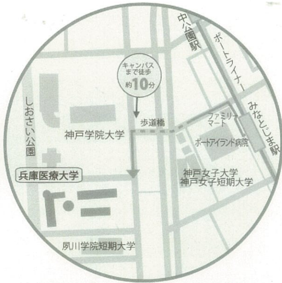
兵庫医療大学アクセス