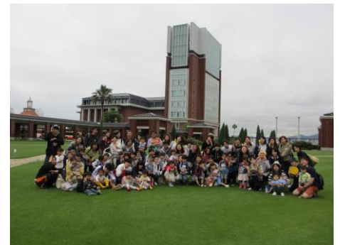
ポーアイキャンパス 芝生(写真1)