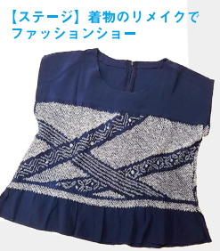
【ステージ】着物のリメイクでファッションショー