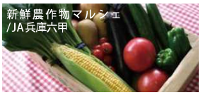
新鮮農作物マルシェ / JA兵庫六甲