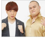
吉本芸人 モンスーン