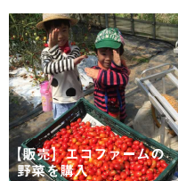
【販売】エコファームの野菜を購入