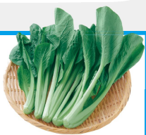
環境共生型農園の野菜 / みずほ協同農園