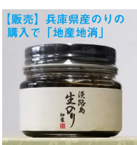
【販売】兵庫産のりを購入で「地産地消」