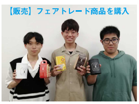
【販売】フェアトレード商品を購入