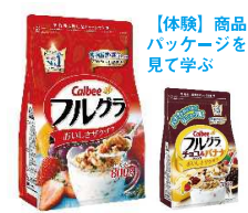
【体験】商品パッケージを見て学ぶ