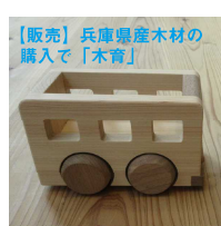
【販売】兵庫県産木材の購入で「木育」