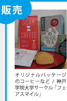
オリジナルパッケージのコーヒーなど / 神戸学院大学サークル「フェアスマイル」