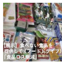
【展示】食べない食品を提供して（フードライブ）「食品ロス削減」