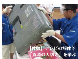
【体験】アレンビの解体で「資源の大切さ」を学ぶ