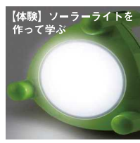
【体験】ソーラーライトを作って学ぶ