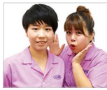
吉本芸人 天才ピアニスト