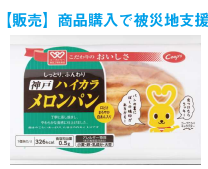
【販売】商品購入で被災地支援