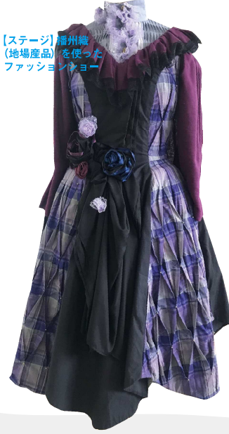
【ステージ】播州織（地場産品）を使ったファッションショー