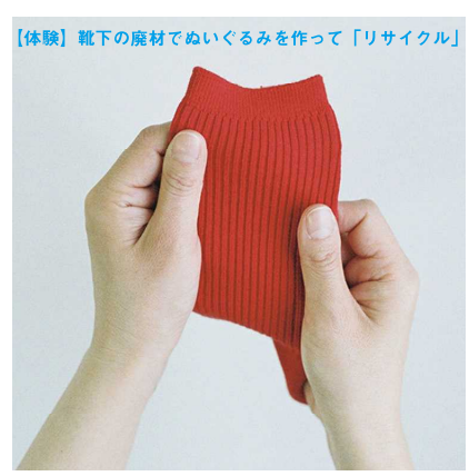
【体験】靴下の廃材でぬいぐるみを作って「リサイクル」