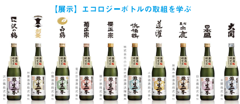
【展示】エコロジーボトルの取組を学ぶ