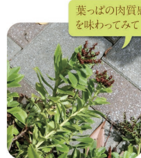
葉っぱの肉質感を味わってみて

マメ科 見頃：通年 漢字で書く「延寿」、病魔を払い寿命をのばす木として親しまれてきた落葉広葉樹。葉が丸くてかわいい。