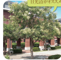
木漏れ日の下で日光浴がオススメ。

モクセイ科 見頃：通年 銀色の葉が美しい常緑樹。果実は塩漬けやオイルに利用できる。10～11月にキャンパス内で収穫してみよう。