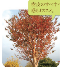
樹皮のすべすべ感もオススメ。

ヒノキ科 見頃：通年 淡い緑の針のような葉が美しい匍匐性コニファー。耐潮性が強く、緑の下の力持的にD号館の周りに鎮座。