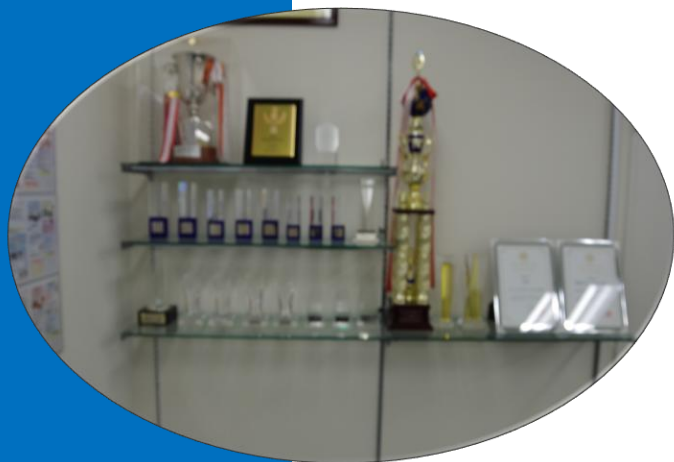
数々の賞を受賞 2025年12月17日