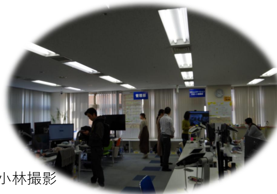
「朝礼風景」 2025年12月17日