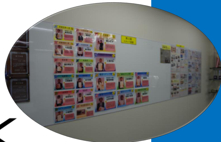
表彰された社員さん方の写真 2025年12月17日