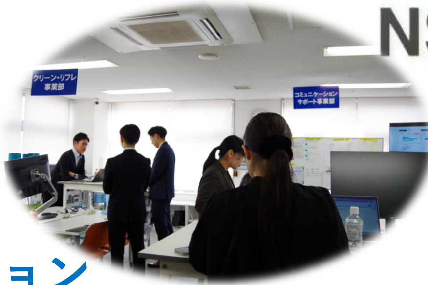
「打合せ中」 2025年12月17日