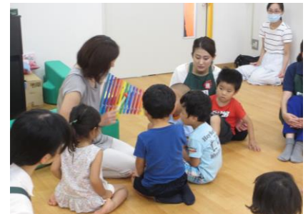
ぼくの名前も呼んで～♪(写真10)

今期2回目のリトミックを行いました。今回は、リズムに着目しながらのプログラムです。2拍子、3拍子、4拍子と、異なるリズムの童謡を歌いながら、スカーフを振ったりタンバリンを叩いたり様々な表現方法でリズム遊びを行いました。幼い子どもたちは音楽がとても好きです。ピアノやシロフォンの音が鳴りだすと、ふっと音のなる方に顔を向け、しっかりと聞きます。リズムや音階の違いで硬い音、柔らかい音、優しい音楽、寂しくなるような暗いイメージの音楽・・・と、様々な音楽の表現ができます。それらを耳で聞き取り、子どもたちができる身体の動きで表現していく遊びを行いました。