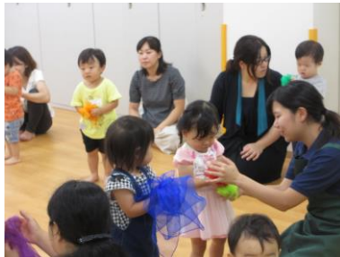
ギュッ、ギュッと硬い音♪(写真8)