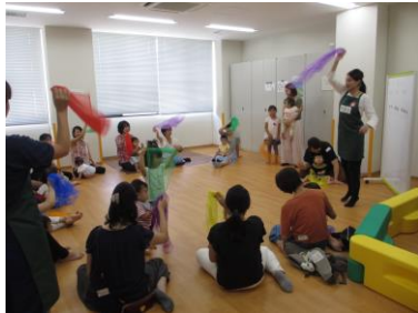
子どもたちは楽しく動くよ♪(写真5)