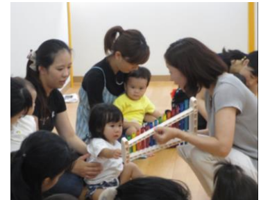
綺麗な音だね♪(写真7)