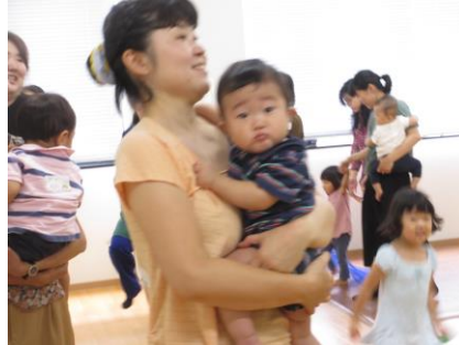
抱っこは嬉しいね♪(写真3)