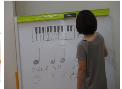
ハーモニー♪の説明(写真4)