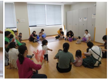
スカーフで表現パッチリ♪(写真7)