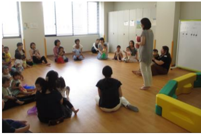
リトミックについての説明♪(写真2)