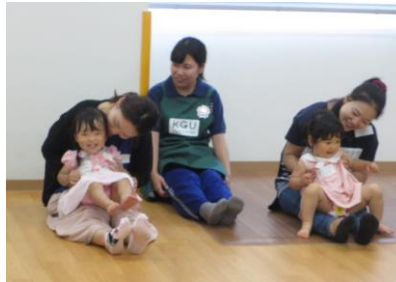
ママに抱っこで音の表現♪(写真6)