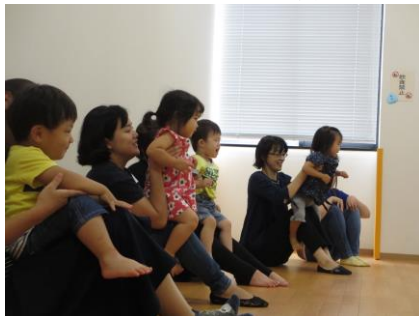
エレベーター、滑り台～♪(写真5)