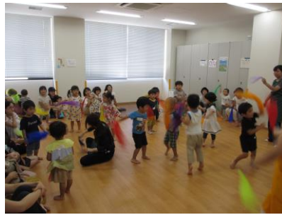
ふわりふわり楽しいよ♪ (写真5)