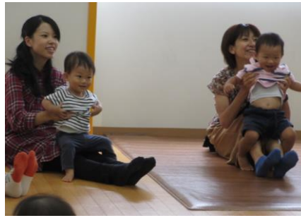
ママのお膝の上は最高♪(写真6)