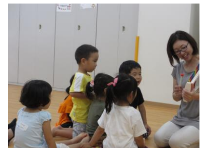
お名前呼んで～♪(写真10)

今期3回目のリトミックを行いました。メロディー、リズムに続いて今回はハーモニーに着目しながら行いました。母親たちには、ホワイトボードを使用して少し専門的な説明も行いましたが、子どもたちに向けては、楽しく身体全体を使って音楽を楽しむようにプログラムされていました。