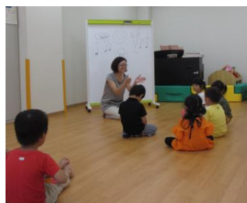
ゾウクラスは子どもだけでOK♪(写真9)