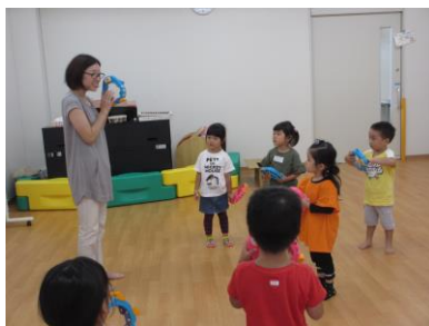
リズムに合わせてできるかな♪(写真8)