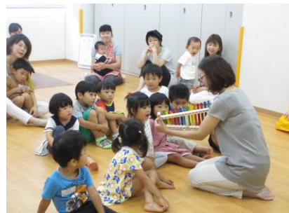
ゾウクラスは子どもたちだけで集合！ (写真6)

特別プログラム「リトミック」今期第1回目を行いました。4回連続ですこしずつレベルアップしていく企画です。年齢ごとに3クラスに分けて行いました。