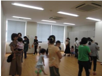
トトロの曲で行進♪(写真2)