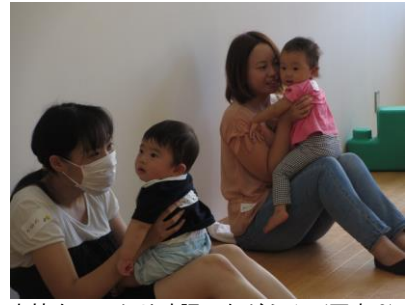
表情をしっかりと確認しながら♪（写真3）