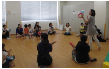
今日はリズム中心です♪(写真3)