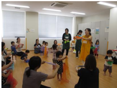
スカーフで音のイメージ♪ (写真4)