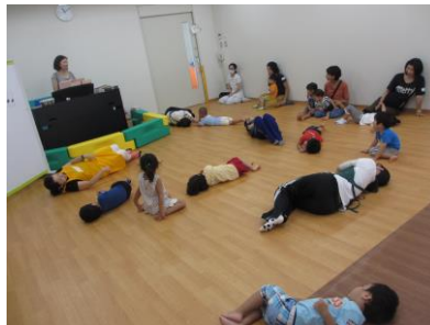
やさしい音でリラックス♪(写真9)