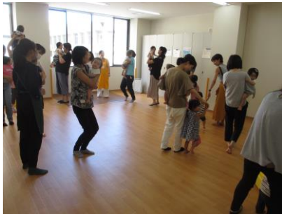
音楽に合わせて行進♪(写真1)