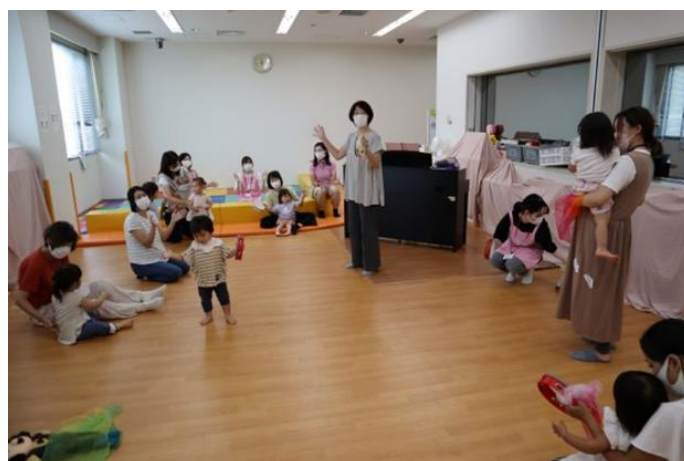
うさぎさんクラス