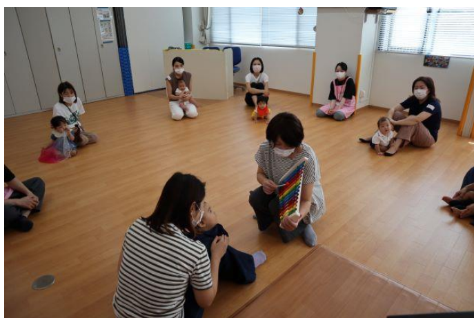
ひよこさんクラス

参加された方々からは、「集団で過ごすことは初めてでしたが、とても楽しそうにしてくれて、家に帰ってからも歌ったり体を動かしたりしています」「遊ぶだけでなく学ぶこともあり、参加してよかったです」等の感想が寄せられました。