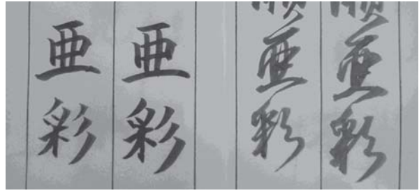
唐様（左）と和様（右）（実習ノートより）

茶席での「書」の役割は、決して小さくない。床飾りの一幅の墨跡で茶会のテーマを表すことができる。また、書画の鑑賞や揮ごうは、茶会に一層の文人趣味をかもし出す。茶会実習にむけて、鑑賞や揮ごうを体験しながら、「茶会の書」における日中文化の統合を考える。