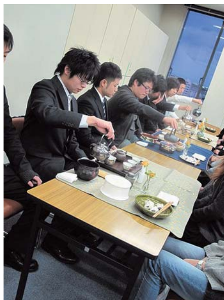
亭主側の男子学生