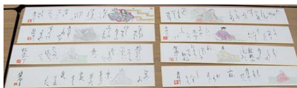
マイ百人一首 (作品例)

江戸時代には、「御家流」とよばれる「和様」の書体と、「唐様」とよばれる中国風の書体が存在した。自分のサインをこの2つの書体で書き分け、書体が発す