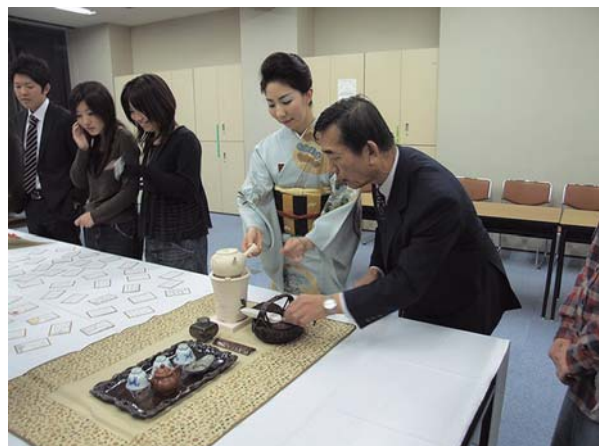
展覧席（第一回学生茶会より）