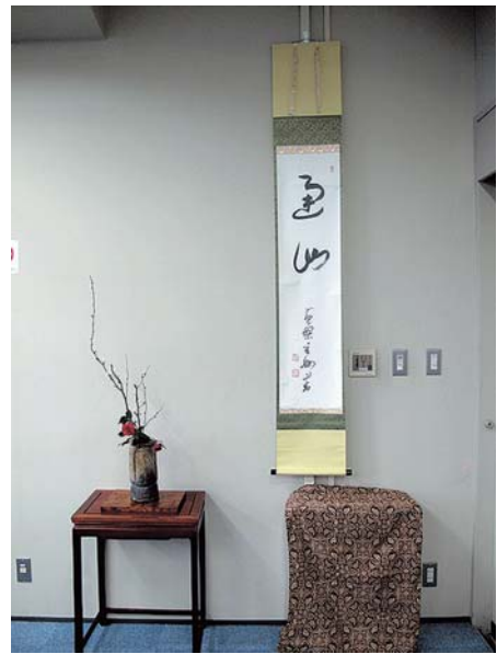
学生茶会のしつらえ

以下はシラバスに挙げた実習5回分のテーマと内容である。④は主に和菓子の季節感や見立てについて、⑤は日本の生け花の歴史文化に触れるなど、内容に少々の変更を加えた。