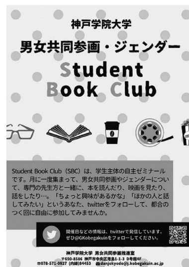
図1. ブッククラブ告知ポスター

Twitter によって活動内容が可視化されていることから、他大学の同様の自主ゼミナールのコミュニティ（近畿大学、京都大学等）ともつながり、互いが主催するイベントや読書会に参加するなどの交流も行っている。