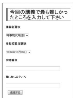
図1. 学生の疑問入力