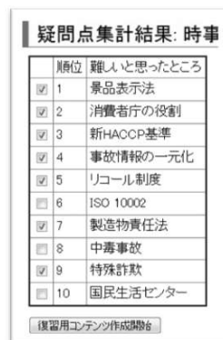
図2. 疑問点集計結果表示