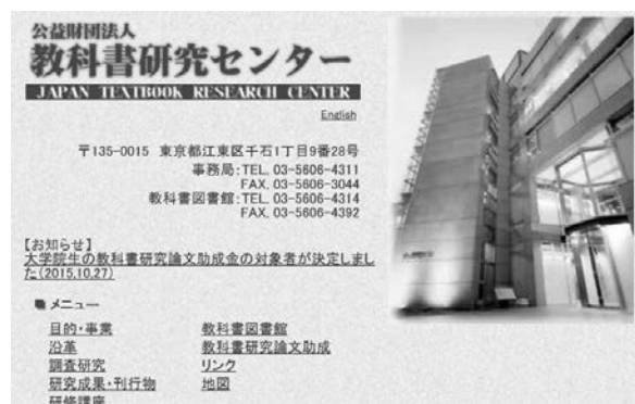
図5. 教科書研究センター