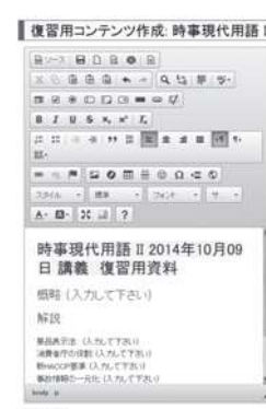
図3. OCW 作成