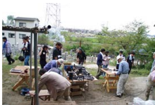
写真1 焼いた炭を使ったふれあい里山会による工芸体験企画の準備風景 2016年9月14日

毎年12月に行われている神吉山ウォーキングは町内会が主催し、毎回200～230人が参加しているとのことである。里山会はウォーキングにおいて、マラソンに例えるとコース係のような役割を担っている。ウォーキングの参加者は回覧板で募集しており、神吉町内会外の方でも、当日の飛び入り参加が認められている。なお当日は、おにぎりや汁物が提供される他、子ども向けのビンゴ大会等も行われているという。