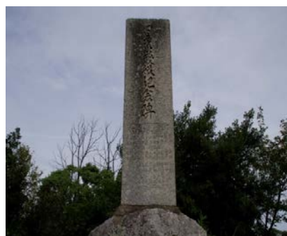
写真2 北山にある日露戦役記念碑