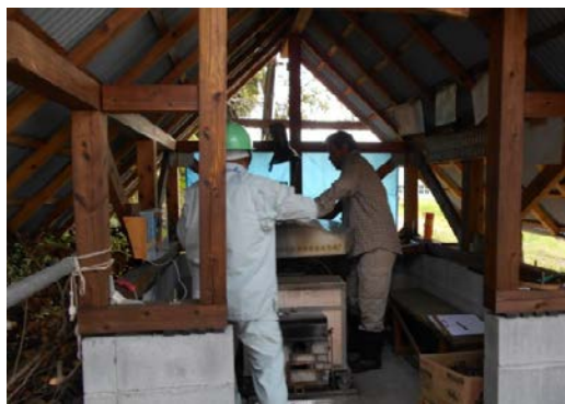
写真 3 炭焼きをしている様子