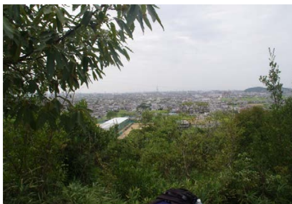
写真1 神吉山から見た神吉地区

一方で聞き取り調査の結果から、次のような課題があることが分かった。現在町内会には約80軒の空き家があるが、加古川市も空き家バンク制度を設けているが、私達が調べた範囲では空き家バンクの登録欄に神吉地区の空き家はなかった。また、町内会は約100人の独居老人を把握しているが、市の管轄であるため個人情報保護の点から、町内会としては対応しにくいそのため、現在の取り組みとしては、民生委員、女性部、老人クラブが担当する、ゆうあい訪問見守り事業により、1か月に2回の見回り活動をしているとのことである。しかし、現状は助けが必要な人が自らSOSを出すことにより、市の担当者に来てもらっているとのことである。町内会長としては、身近な人に高齢者への関心を高めてもらって交流を持つようにすることで解決していきたいとのことである。