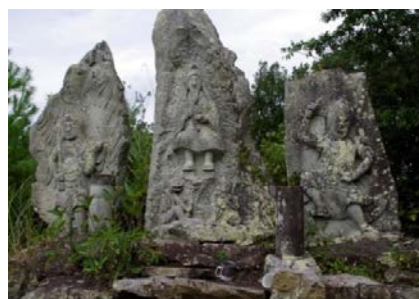
写真3 行者山にある行者菩薩。右から不動明王、役行者、蔵王権現