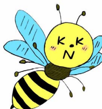
図1 ミツバチの「カンキチ」 作：矢嶋ゼミ谷川夏鈴

神吉山の特徴や他地域の事例を踏まえ、SNSや観察会といった気軽に参加できる行事の中で、地域の特徴や生物を活かしたPRを行うことが効果的ではないかと思われる。2節で挙げた千葉県市川市の事例では、小学生の自由研究や家族連れを狙いとした写真パネルの展示や生き物の観察会を積極的に行っていた。また、群馬県で行われているNPO法人「森の学校」では、子どもを対象にした野生動物の観察会など、子どもが関心を持てるような取り組みを行っていた。そこで、神吉山に生息する動植物の写真パネル・実物の展示を行い、小学生の自由研究や家族連れを狙いとした展示会を開くのはどうだろう