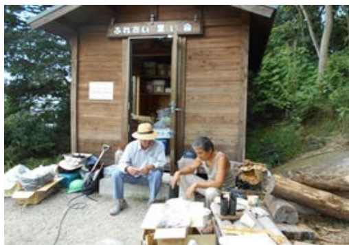
写真 2 ふれあい里山会的小屋