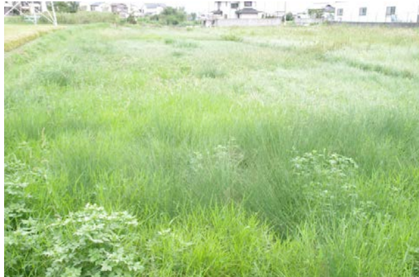
写真2 休耕している田んぼ

かつて生息していた生物について、里山周辺の環境がここ何十年かの際に大きく変わったため、里山周辺の生物も大きく変わった。例えば、ツバメは最近の家屋の形状などの変化により巣を作る場所がなくなり生息数も激減した。タヌキも多く見られていたようだが、一時期数が増加した野良犬の発生により、タヌキが怯えて出てこなくなったという。