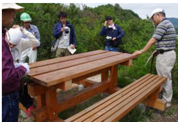
写真1 東播工業高校製作のベンチ 2016年9月15日