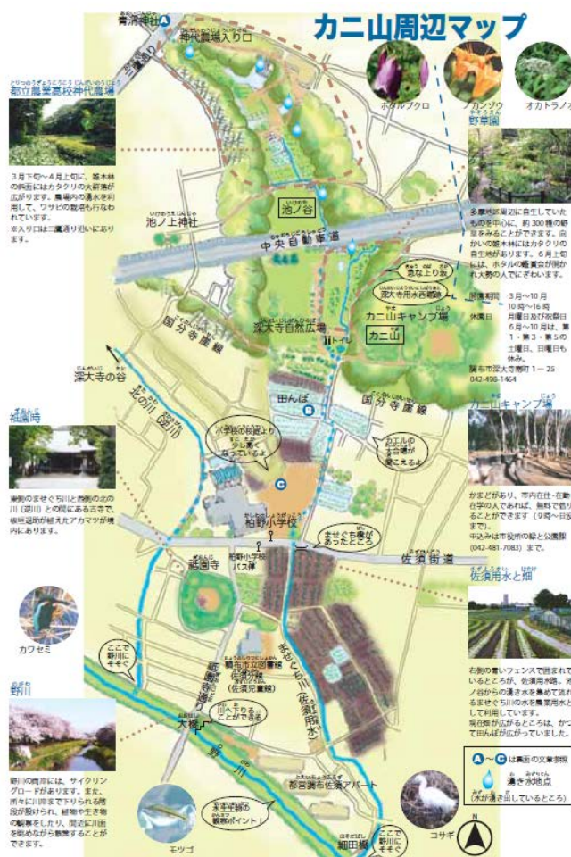
図1 カニ山周辺マップ 穂坂 (2013) より