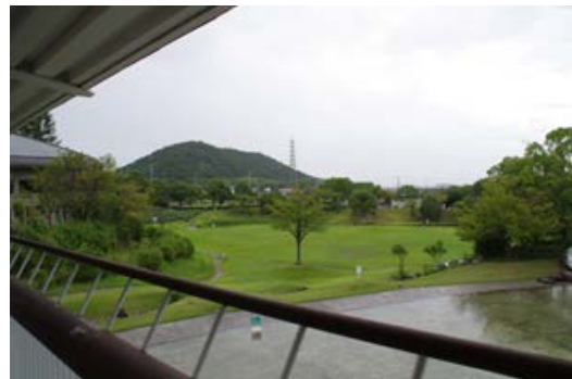
写真2 加古川ウェルネスパーク屋外の芝生 2016年9月14日

日頃から、加古川ウェルネスパークへの来訪者が多いため、新たなスポーツイベントを企画することや、趣向を変えたイベントを行うことで、新規の参加者が見込めることが期待で