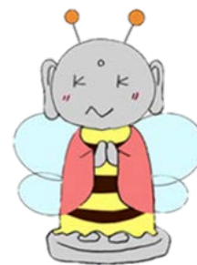
図1 カンキチ地蔵 作：矢嶋ゼミ谷川夏鈴

それに加え、家族連れの子どもをターゲットに歴史のマスクットキャラクターを提案したい。神吉山には、西国播磨三十三カ所観世像があるが、子どもを守るのは地蔵菩薩と考えられることから地蔵像を取り上げ、生物班で作成したミツバチのマスクットキャラクターの「カンキチ」をお地蔵さん風にアレンジし、「カンキチ地蔵」としてみた（図1）。里山と歴史が合わさったキャラクターとして用いることで、子どもに興味を持ってもらえるのではないかと考えた。これをパンフレットの地図に用いたり、ステッカーを制作して地域住民や地元の小中学生に配るなどして活用していくことが出来るのではないだろうか。