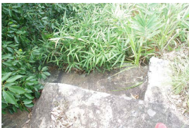
写真 1 神吉山の石切り場の跡

小山さんによると、神吉山は、昔は村全体で薪炭・肥料の活用を行う入会地であった。また、竜山石が多く取れたため、石切り場として神吉地区の住民が利用していたとのことである(写真 1)。1877 年に、神吉山が官有地となり、払い下げられた。しかし住民が活用していたことから、寄付を募って 1887 年に買い戻しを行った。中山の山頂には、この出来事を後世に残すために記念碑が建てられている。