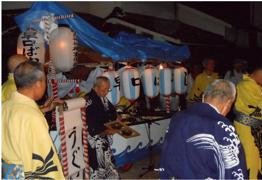
(楽器を弾いている保存会の方たち)