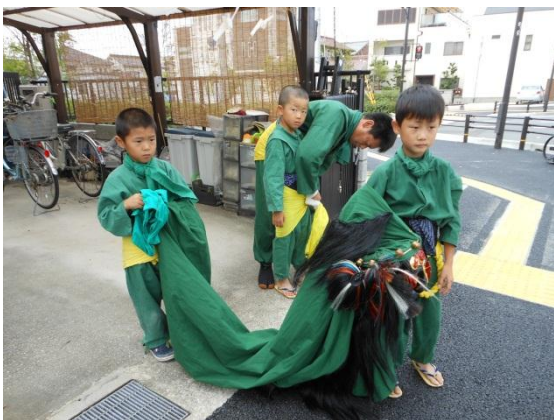
獅子舞を持つ子供