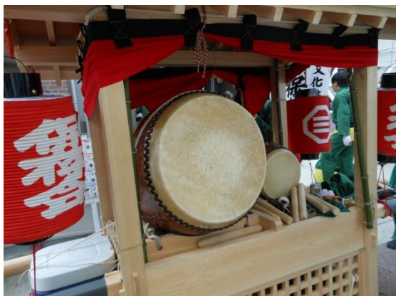
だんじりに乗っている太鼓

※人がいない場合は次に向かうか、玄関前でお祓いだけして次の家に進む。喪中や断られた場合はお祓いはしない。