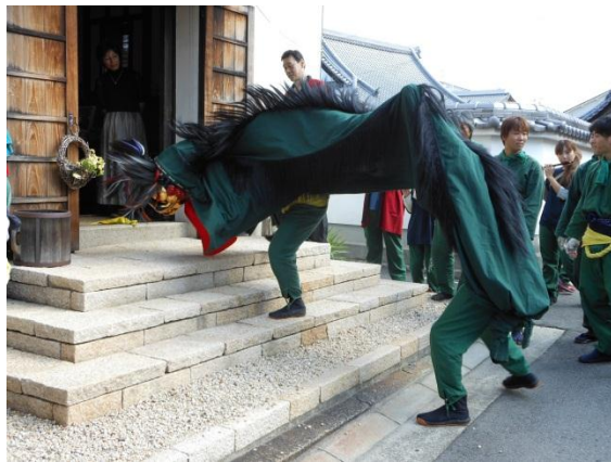
お祓いをしている様子