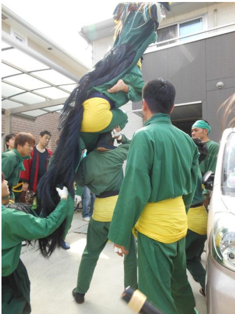
大技である三人担ぎをしている様子