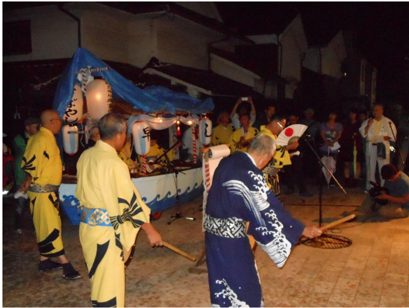
(豊年づくしを唱えている様子)

題目は、江戸時代の歌が現在でも使われているが紙などに記憶されておらず、いわゆる口伝で代々伝えられているので、その代の歌い手によって元の曲からメロディーが変わってしまっていたり、歌詞も徐々に変わってしまっている。また、現在は後継者不足に悩まされている。