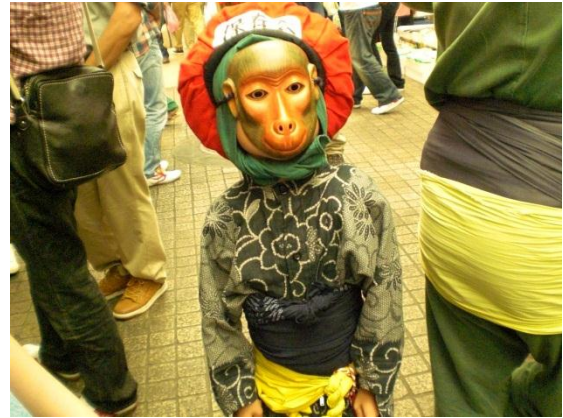
猿のお面を被った子供