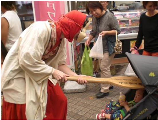
おかめが子供の頭を撫でている様子 頭を撫でられると頭が賢くなると言われている。