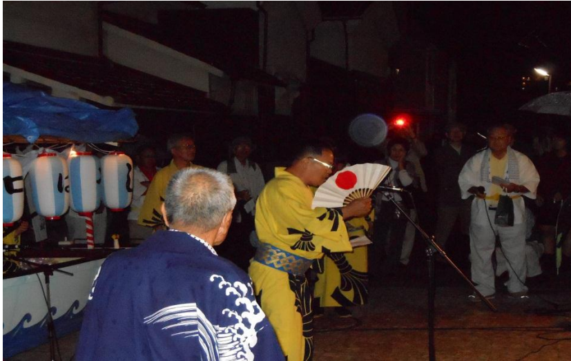
(扇子で顔を隠しながら唱えている様子)

題目を唱える際に扇子で顔を隠しているのが特徴的だが、実際はメガホンやマイクなどの拡声器がなかった時代に声を反響させる工夫が現在も残っているのである。稲爪神社の早口流しは、海や山、お伊勢参りなどの江戸時代の明石の住人達の生活や文化などに深く関わっていたと思われる題目が多い。