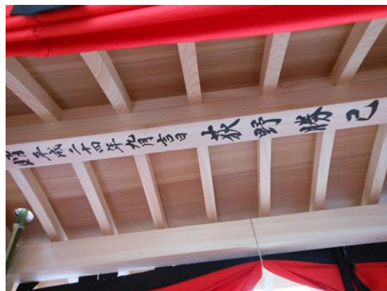
だんじりの屋根の裏ある銘