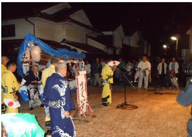
(うぐいす鳥を唱えている様子)

元々は、浜の組という漁師たちの寄合が主となって行っていたこともあり海のことについての題目が多い。内容はお伊勢参りの旅に例えたり、竜宮城までの旅に例えたりしている。オチがあるので小噺や落語などのように感じることもできる。