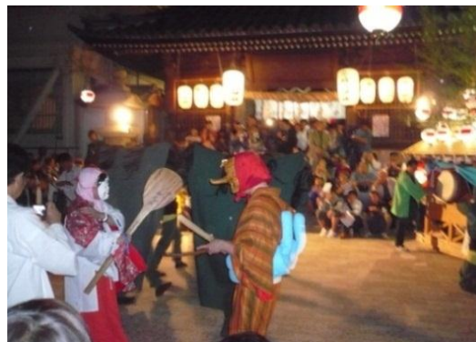
写真 9 : 三神の舞以外でも、登場するおかめ、てんぐ、センマ。天狗は子供を怖がらせたり、センマは観客が連れていた犬とあそんだりもしていた。