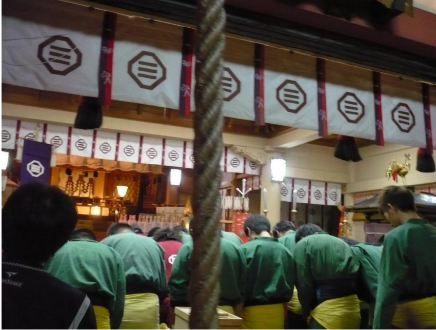
保存会の宮入奉納の様子