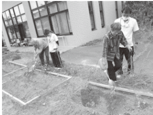
図1.農作業“かん水”の様子

6種類の農作業を提供したところ、METs (最大値)は“耕うん”が 4.92 \pm 1.39 METsと最高で、最低は“播種” 2.35 \pm 0.30 METsとなり、運動強度は“耕うん”、“畝たて”、“定植”、“かん水”、“除草”は中強度、“播種”は低強度となることがわかりました。また、支援や介護が必要となり始めた高齢者を対象とした場合、園芸作業のMETsは、平均値だけで見ると低強度に見えても、作業中、一時的には中強度の負荷がかかることが明らかとなりました。さらに、提供した園芸作業をベースに他の園芸作業も組み合わせることで1週間に約8~12 METs・時以上の運動量となり、高齢者の健康維持や認知症予防のアクティビティとして園芸作業が有効であることが明らかとなりました。