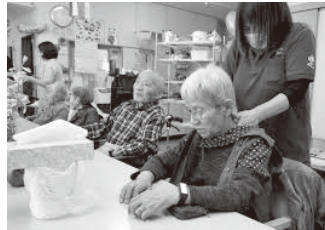
図2.アロマテラピーの様子