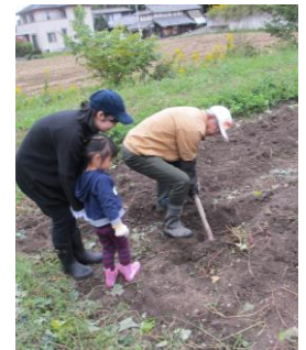
お芋が見つかるかな（写真4）