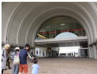
キャンパス内(写真10)