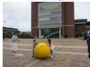
のびのびと大玉転がし(写真7)