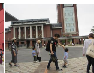
キャンパス内(写真12)