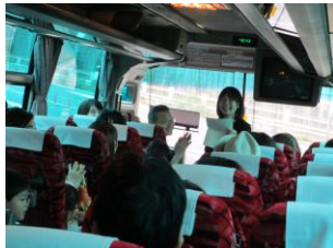
車内でお名前呼び(写真2)