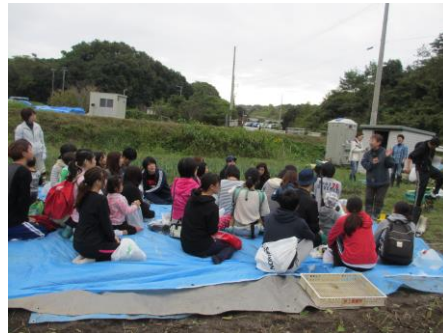
クルレの先生の話（写真3）