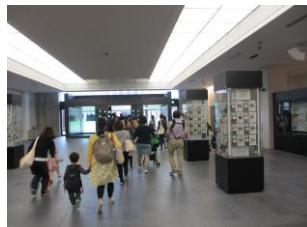
キャンパス内(写真3) 珍しい生葉の標本を見ながら