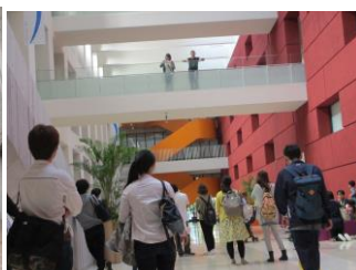
キャンパス内(写真11)