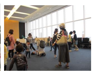
大会議室(写真13) 窓からの景色は抜群

ポートアイランドキャンパスへの遠足を行いました。有瀬キャンパスで集合し、それぞれの家族と担当の学生との顔合わせを済ませてからバス2台に分乗して向かいました。心配していたお天気は、なんとか曇り空で現地の広場で遊ぶことができました。学生たちがシャボン玉・大玉・凧揚げなどを準備すると、子どもたちは好きな遊びを選んでたっぷり学生と遊んでいました。広々とした場所で走り回ってはしゃぐ様子は、日頃プレイルームで見るとも晴れ晴れと明るくとても元気でした。