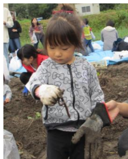
大きなミミズも へっちゃら！？（写真6）