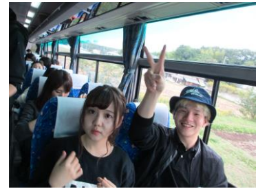
バスの中でお名前呼び（写真1）