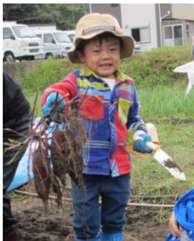
やった！たくさん収穫できた！ （写真5）