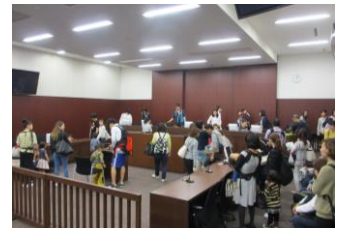
パパの目もキラリ☆ 法廷教室(写真9)