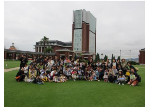
ポーアイキャンパス 芝生(写真1)