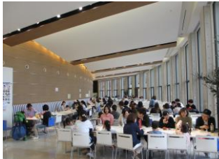
大学のカフェで昼食(写真8)